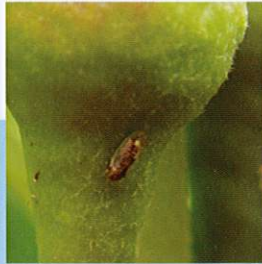
Armut Psillidi ( Cacopsylla pyri )