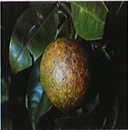
Turunçgil Kırmızı Kabuklubiti ( Aonidiella aurantii )

SMİLODON kükürt, captan ve folpet aktif maddeleri içeren ilaçlar ile karışmaz. Şayet söz konusu bitki koruma ürünleri bitkiye uygulanmış ise SMİLODON uygulaması için 20 gün beklemek gerekmektedir. SMİLODON tek başına kullanılmalıdır.