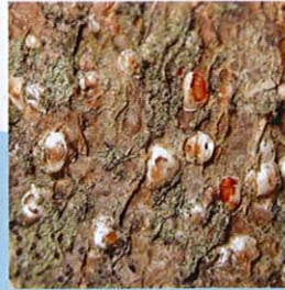
Dut Kabuklubiti ( Pseudolacaspis pentagona )