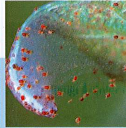
Kırmızı Örümcek ( Tetranychus spp. )