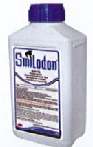
Ambalaj Şekli: 1 L * 20 adet 5 L * 4 adet 17 L * 1 adet

RUHSAT SAHİBİ VE İMALATÇI FİRMA: SAFA TARIM A.Ş.