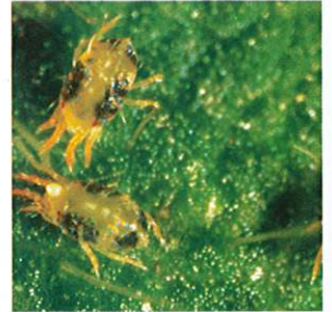
İki Noktalı Kırmızı Örümcek ( Tetranychus urticae )