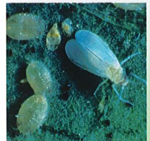
Beyaz Sinek ( Bemisia tabaci )