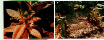
Çökerten ( Fusarium spp. )