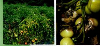
Çökerten ( Pythium spp. )