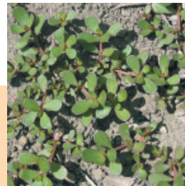
Semiz Otu ( Portulaca oleracea )