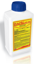
Ambalaj Şekli: 1 L * 20 adet