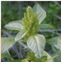
Kırmızı Köklü Tilki Kuyruğu ( Amaranthus retroflexus )

Ayçiçeğinde Acetochlor aktif maddeli ilaçlar ile tank karışımı yapılarak pre-emergence olarak uygulanabilir.