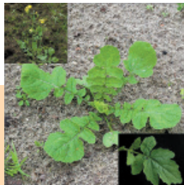
Yabani Turp ( Raphanus raphanistrum )