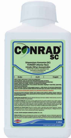
Ambalaj Tipi - Kolideki Adedi 200 ml * 40 adet 1L * 20 adet

CONRAD SC' nin domatesteki uygulamalarında yayıcı ve yapıştırıcılarla karıştırılarak kullanılması önerilmez. Pirimiphos methyl, Pirimicarb, Lambda-cyhalothrin ve Chlorothalonil ile karıştırılabilir.