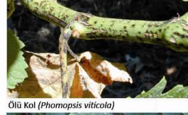
Ölü Kol ( Phomopsis viticola )