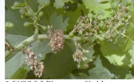
Bağ Mildiyösü ( Plasmopara viticola )