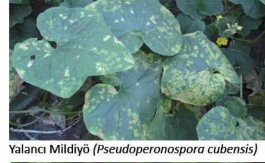
Yalancı Mildiyö ( Pseudoperonospora cubensis )