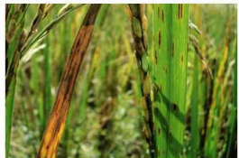
Çeltik Yanıklığı ( Pyricularia oryzae )