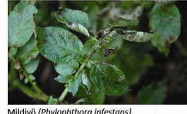
Mildiyö ( Phytophthora infestans )