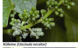
Külleleme ( Uncinula necator )