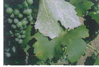
Mildiyö ( Plasmopara viticola )