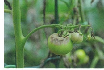
Geç Yanıklık (Mildiyö) ( Phytophthora infestans )