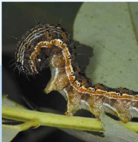
Yeşilkurt ( Helicoverpa armigera )