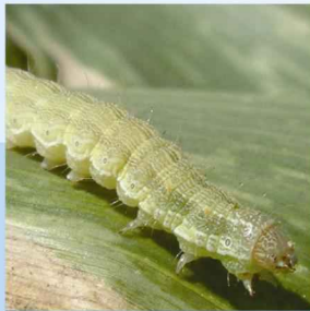
Yeşilkurt ( Helicoverpa armigera )