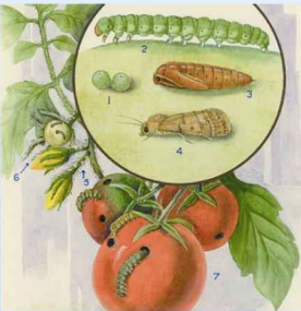
Yeşilkurt ( Helicoverpa armigera )

Tek başına kullanılır. Diğer ilaç ve gübrelerle karıştırılmaz.