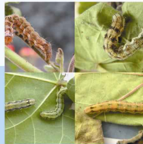
Yeşilkurt ( Helicoverpa armigera )