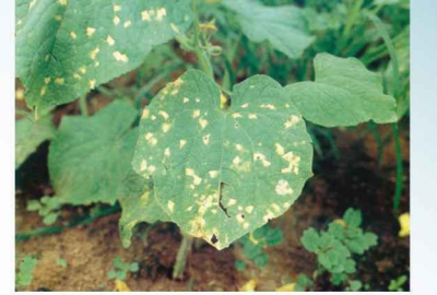
Yalancı Mildiyö ( Pseudoperenospora cubensis )

Diğer ilaçlar ile karıştırılarak kullanılmasına gerek yoktur.