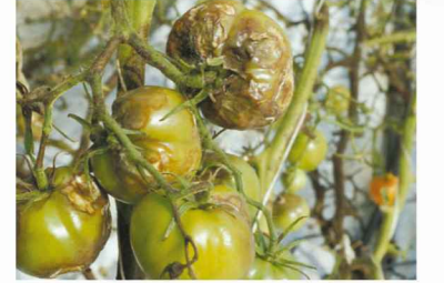
Mildiyö ( Phytophthora infestans )