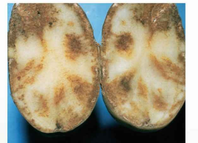
Mildiyö ( Phytophthora infestans )