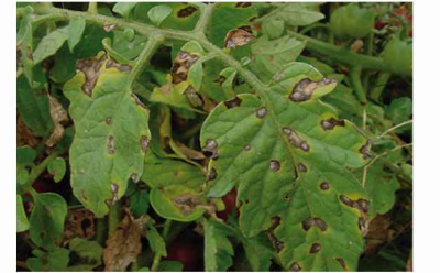
Erken Yaprak Yanıklığı ( Alternaria solani )